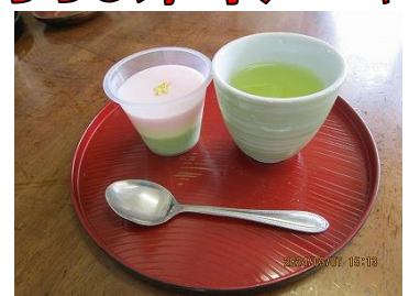
ひな祭り風ババロア