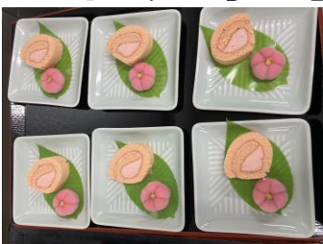
2種の桃色デザート