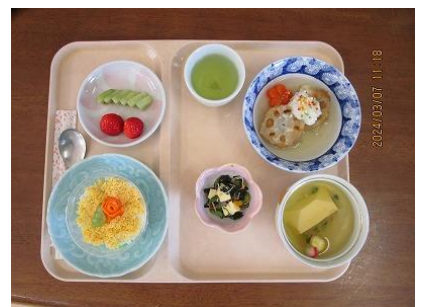
ちらし寿司ケーキ